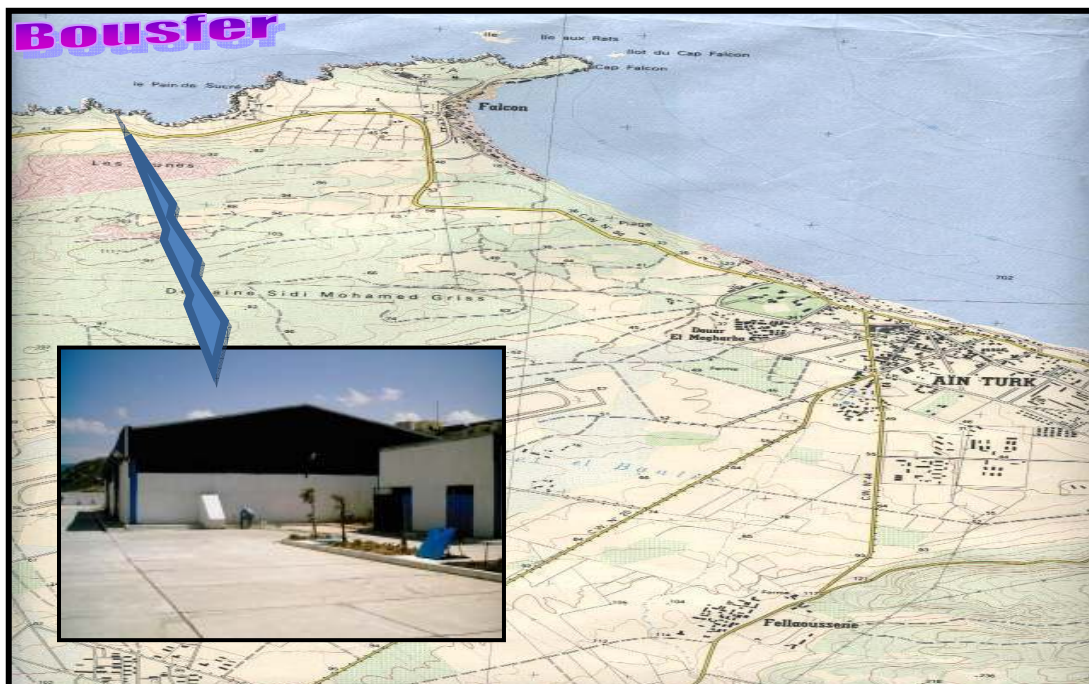
Fig. 2 : Localisation de la station de dessalement de Bousfer.